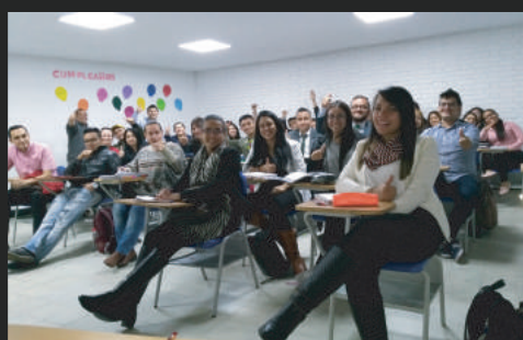
ERASMUS- "students 4 change" Innovación y Emprendimiento Social en el aula