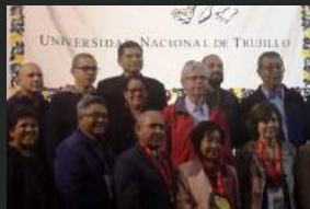
VI Congreso Latinoamericano de Plantas Medicinales Universidad Nacional de Trujillo, Perú