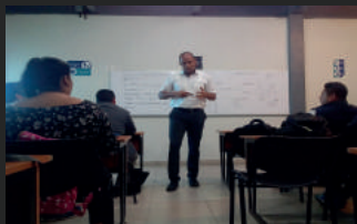
Primer Profesor UNIMINUTO Participante del Programa PILA