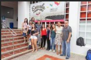
UNIMINUTO Barranquilla en la Escuela de Verano de la UTB