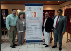
XII Encuentro Internacional de Investigadores de la RLCU, El Salvador