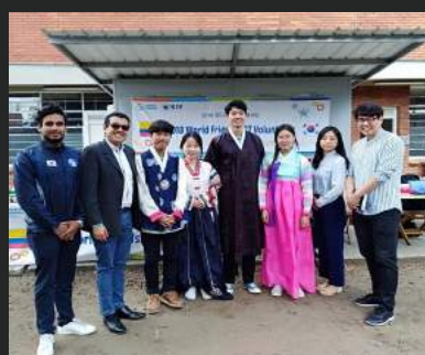
8 Estudiantes Provenientes de Corea del Sur visitaron el Parque Científico de Innovación Social - PCIS

¡Sé parte de nuestros #EmbajadoresUNIMINUTO en el mundo!