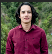
Estudiante del Centro Regional Pereira Ganador del III Concurso de Fotografía de la RLCU