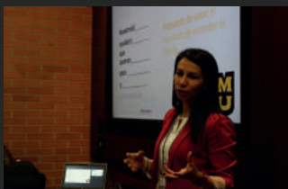
Conferencias Customer Discovery and Value Proposition