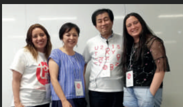
Tokyo Innovation Summer Program 2018