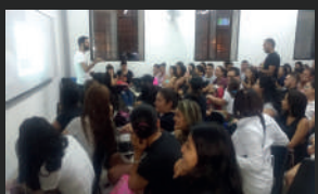
Cultura Egipcia en UNIMINUTO Ibagué