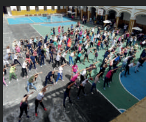
Rock your Body Immersion Club de Inglés