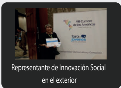
Representante de Innovación Social en el exterior