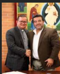
Convenio Interinstitucional con Texas State University