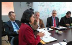
Memorando de Entendimiento con la Universidad de Missouri