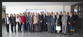
ODUCAL y Encuentro de Redes de Universidades Católicas

Durante el 2018, la Oficina de Asuntos internacionales se ha planteado el reto de reforzar las alianzas existentes y abrir espacios de cooperación con otras instituciones de educación superior en todo el mundo, es por ello que en el primer trimestre se han generado nuevos convenios en pro de la comunidad.