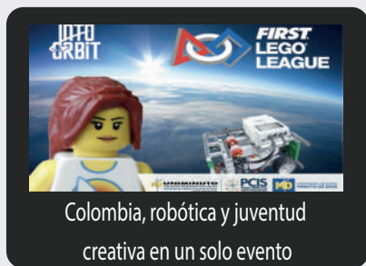
Colombia, robótica y juventud creativa en un solo evento